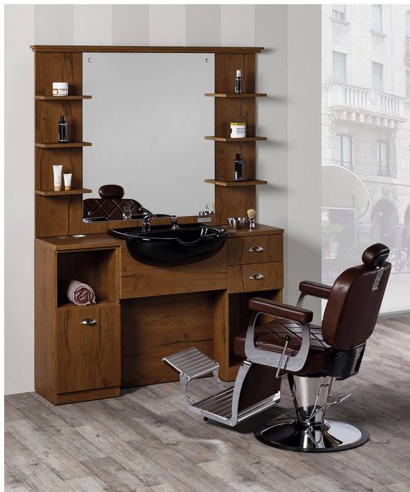
OBERFLÄCHEN IM FOTO: VINTAGE 01

Le immagini sono fornite al solo scopo illustrativo e non costituiscono elemento contrattuale