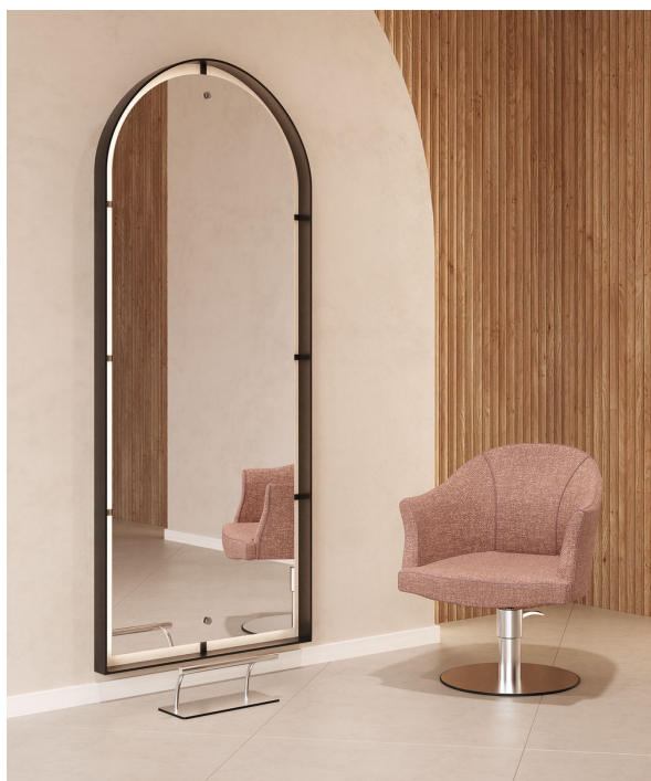
Le immagini sono fornite al solo scopo illustrativo e non costituiscono elemento contrattuale